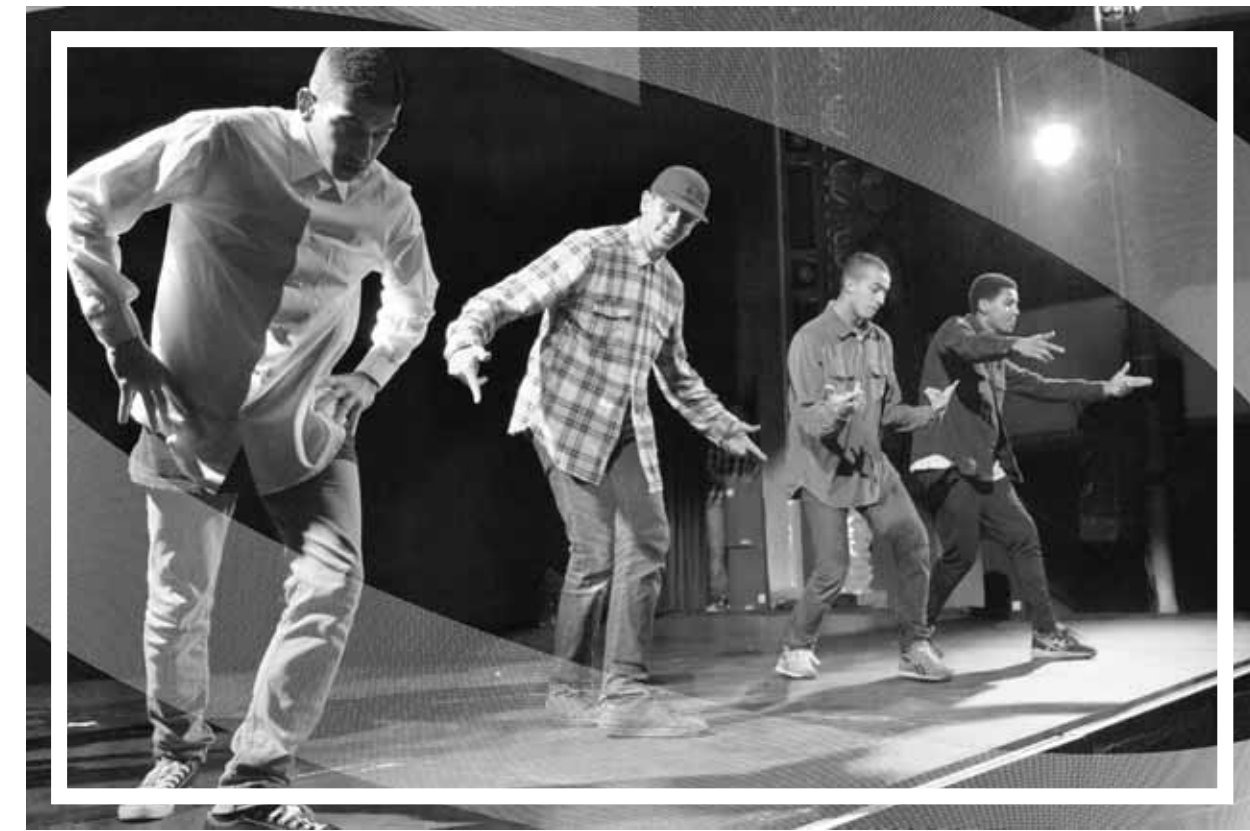
Les Mad boy'z Crew dans leur chorégraphie « Welcome to mad land » le 8 octobre au Kursaal de Besançon.

Danser, c'est ce que le Mad boy'z crew fait depuis 2007 à Besançon. Ils sont une dizaine dans l'association et s'entraînent à l'Asep, 9 à 12 h par semaine, dans le but de participer à des battles. « Récemment, on est allé en Autriche et en Suisse. Cette année on prépare un gros battle à Nantes et on espère se rendre en Belgique et aux Pays-Bas ». Le Clap les intéresse pour avoir accès à des scènes comme jeunes talents le 8 octobre dernier à Besançon. « Dans le groupe, on a en moyenne 6 ans de danse derrière nous. Pour arriver à maturité, il faut 10 ans. On en est encore à apprendre. C'est seulement après avoir acquis les bases qu'on peut com-