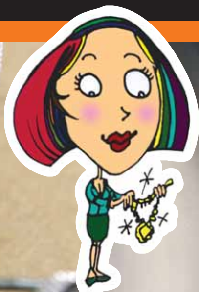
La maroquinerie, un travail de précision.