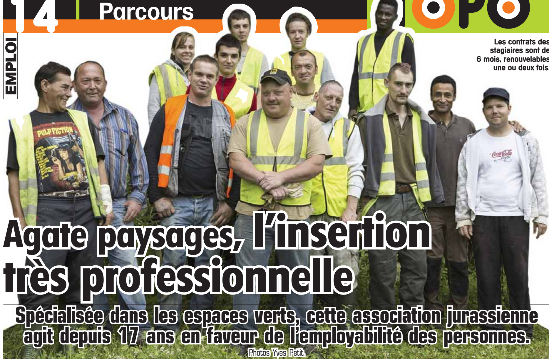
Les contrats des stagiaires sont de 6 mois, renouvelables une ou deux fois.