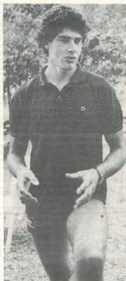
Philippe Boccata, champion du monde de canoë-kayak.

Le CREPS de Châlain accueille en permanence 120 personnes.