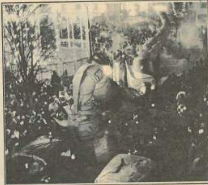
Quinze mille personnes dehors en 93. Combien cette année ?

La mise en scène, foisonnante, sera quoi qu'il arrive à la hauteur, mêlant spectacles théâtraux, mécaniques, musicaux et pyrotechniques. Itinérants, tous gratuits et tous dans la rue : à partir de 22 h, du carré piéton à la halle polyvalente, « cent vingt minutes avec des machines pyrotechniques ; juste après minuit, le feu sera mis au ciel montbéliardais. » Le programme (voir ci-contre), qui se termine par un bal en plein air, comprend également la clôture