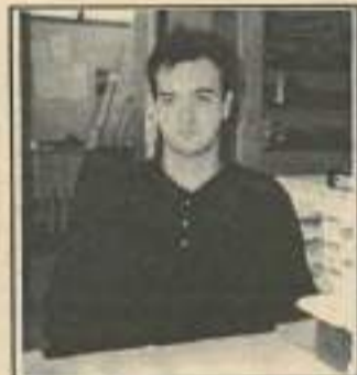
« Je conseille aux jeunes de commencer tôt dans l'animation ».

que c'était quelque chose de nouveau. J'ai appris qu'il vaut mieux aller lentement mais sûrement plutôt que se lancer plein pot et faire des erreurs.