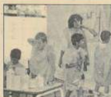
Animateur en Franche-Comté