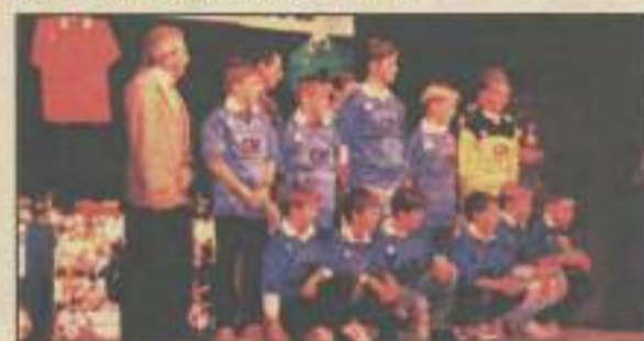
La remise des récompenses aux challengers de chaque district de Franche-Comté, au Kursaal à Besançon, vendredi 27 octobre dernier.