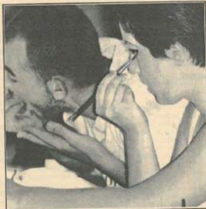
Séance de maquillage, lors d'un stage théâtre.

Embarcadère, 27 rue de la République, 25000 Besançon (81.83.10.94).