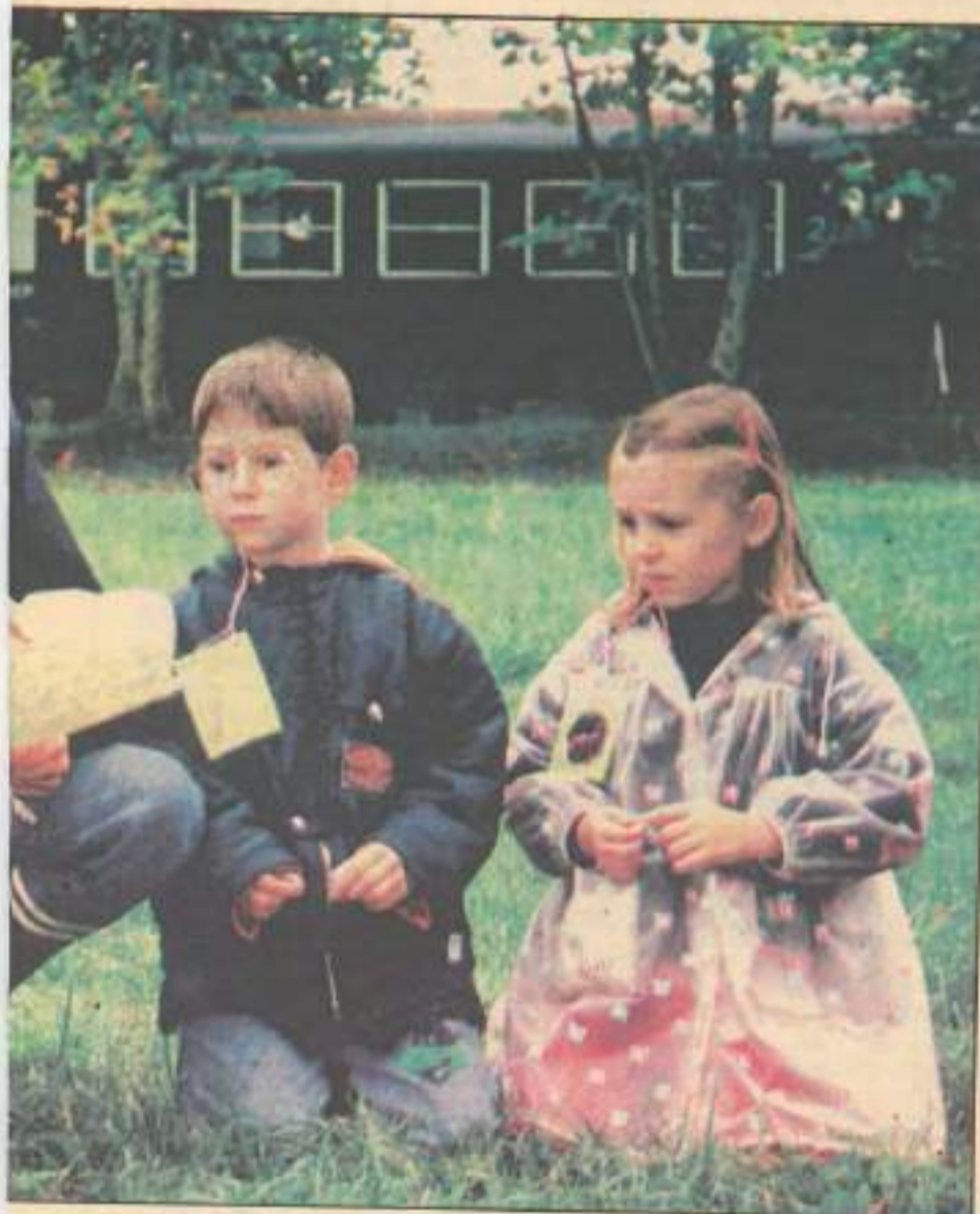
Les éco-interprètes participent à l'initiation à l'environnement, comme ici à la Maison des étangs de la Bresse du Jura. Une formation à ce métier, unique en France, est proposée par les CPIE franc-comtois.