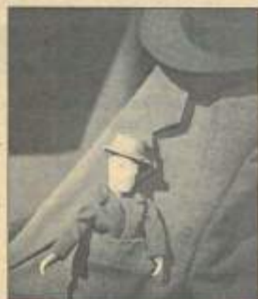
Des marionnettes à la CITERNE