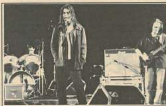
Goah était en concert lors du 1er Salon régional de la jeunesse.

Pour chaque département la présélection se fera d'abord sur écoute, 6 groupes seront retenus et se produiront ensuite sur scène à l'occasion de tremplins qui auront lieu à Besançon (25), Brainans (39), Vesoul (70) et Belfort (90).