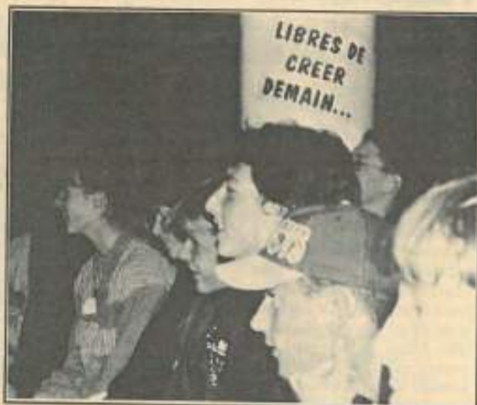
Le 11 novembre dernier, 250 jeunes étaient réunis à Pirey pour le rassemblement régional.

« Les projets ne sont jamais plaqués dans telle ou telle loca-