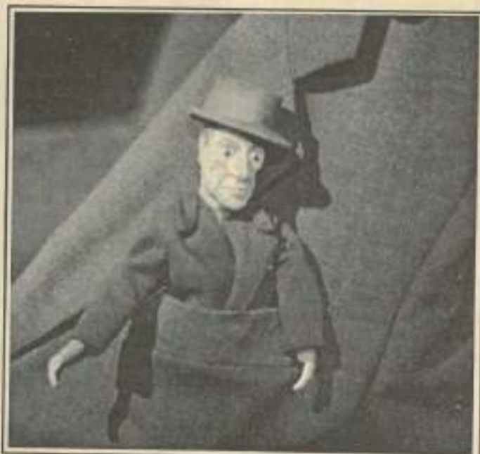
« Detective blues », du 19 au 27 janvier.