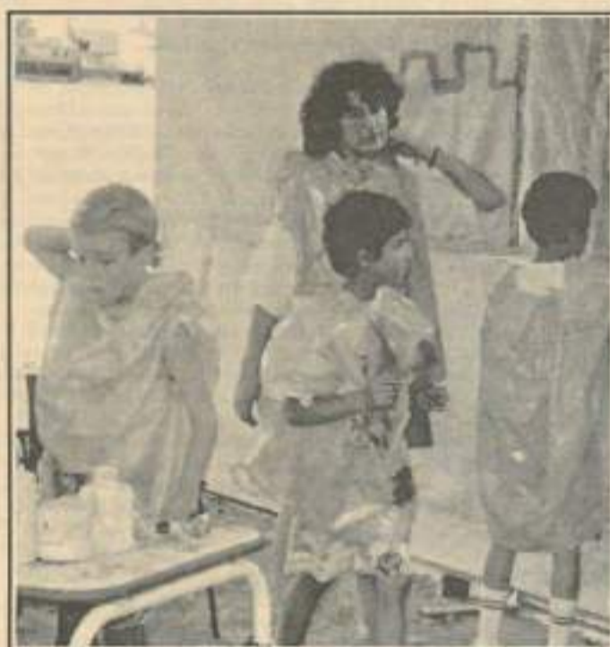
Dans la région, on compte l'équivalent de 1000 postes salariés à temps plein