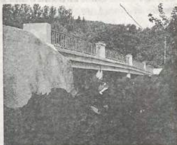
Le pont de Scey-Maizières a trouvé une seconde jeunesse.

Un travail de protection des berges a également été réalisé en plusieurs endroits sur la rivière