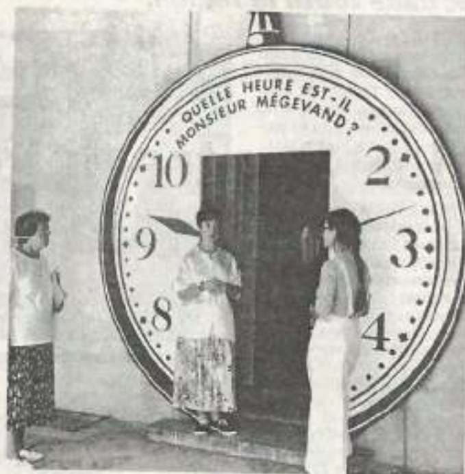
Née au XVI ème siècle, la montre ne nous a plus quitté

Voir l'exposition, c'est voir l'identité de la ville, contempler avec nostalgie une époque glo-