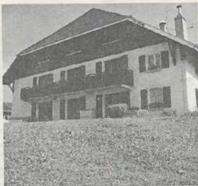
Un centre qui accueille les familles du Doubs.

Cette base relève du fait associatif et de l'éducation populaire. La CAF, qui a investi 2,66 millions de francs (sur 6,5 millions) dans la rénovation privilégiée pour l'instant la formule de séjours courts (100 F par enfant et 100 F pour le couple).