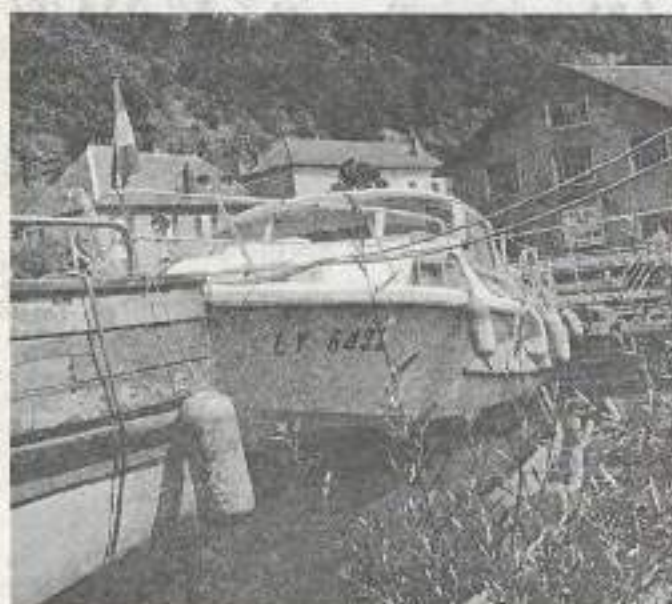
Dans la région, 320 km de voies navigables.

Et pense au confort : les installations d'accueil sont l'objet d'un traitement paysager et les berges vont être restaurées.