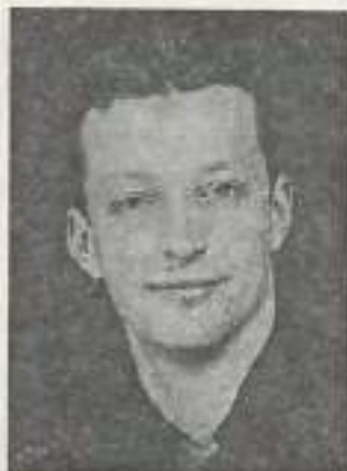
Un cadre très satisfait de son poste : "J'ai la chance d'exercer un métier varié".

Le sens du commerce, c'est indéniable. Le sens du contact : il faut que le courant passe avec les gens qu'on rencontre. Les mettre à l'aise, discuter de leurs problèmes et vendre des prestations élevées sur lesquelles il y a de la concurrence. Ça se chiffre en millions de francs, donc on ne peut se per-