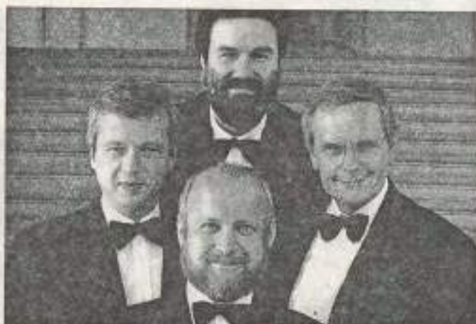
Le Quatuor Alban Berg interprétera Beethoven et Webern.

ans, aura lieu le concours international de composition musicale, les 12 et 13 septembre. Ce concours deviendra biennal à partir de cette année, "pour laisser suffisamment de temps à l'écriture des partitions". Il alternera désormais avec le concours de jeunes chefs d'orchestre. Lequel n'aura donc pas lieu cette année, mais en 95.