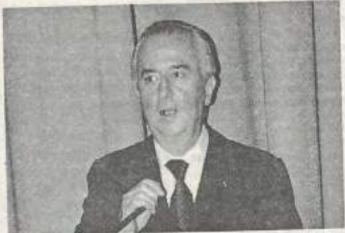
Le Premier ministre l'a promis, le questionnaire sera suivi de mesures concrètes.

Elaborer un questionnaire, analyser les réponses, proposer des actions concrètes et veiller à leur suivi : le comité a du pain sur la planche, pour combler le déphasage entre jeunes et "décideurs". Car actuellement, 61 % des jeunes interrogés par sondage "éprouvent de la méfiance à l'égard de la politique". Et 20 % seulement l'associent à