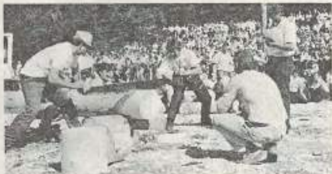
Une fête qui a rencontré un joli succès l'an dernier.

La part belle aux bûcherons, bien entendu : concours international amateur et professionnel où sont requises rapidité et précision, démonstrations d'écorçage, abattage, élagage... et aussi tracteur télécommandé, robot ébrancheur, Sylvatec (un robot qui fait le travail des bûcherons).